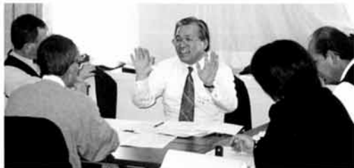
平成10年度管理者基礎研修

ホームページアドレス http://www.nagano-keiyukai.or.jp