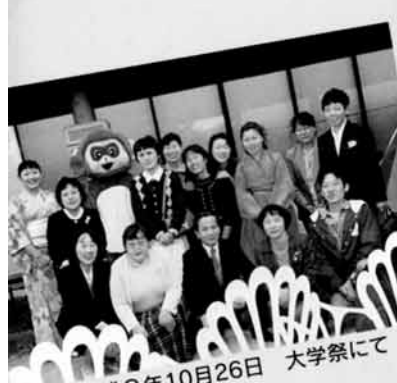
平成9年10月26日 大学祭にて

友と喜び、笑い、そして語り合った日。 学園生活はそれぞれの心のアルバムに描かれた大切な1ページ