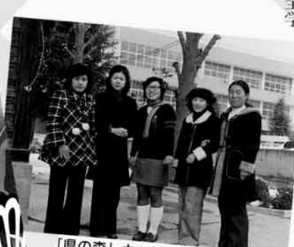
「県の森」キャンパスにて

今も半分は母親、半分は税務のプロとして頑張っているのも、短大でのお導きの賜物と思っております。これからも卒業生としていつまでも輝いていたい、自負しております。