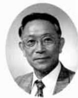
商学園短期大学のサーバを 接続し、イ ンターネッ トを体験するコーナーを設け る。

このたび記念展を担当するにあたり、松商学園創立二〇〇周年の歴史をふりかえる機会にめぐまれ、創立者、関係者の苦勞の数々、「自主独立」の精神を基本にした教育理念などに触れたとき、心より松商学園の卒業生である喜びを感じました。そして、私たちが、社会で活躍できるのも、この素晴らしい先人と伝統の賜物と感謝の念にかられながら、この二〇〇周年記念事業を、同窓生全員の力で成功させなければと強く感じているところです。