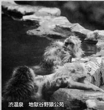
渋温泉 地獄谷野猿公園

と「自然保護という言葉」は、人間が自然を保護しなければならぬというより、自然界に人間は守られているという観念に立つことによって、自然保護という言葉がより一層、大切なものであると痛感できるのでないかと思われれます。