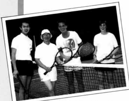
▲ローエン(ノルウェー)のコートでドイツ人の学生ペアと(1988年8月)

アルプスの残雪と桜、アルプスの新雪と紅葉をバックに何時までもテニス続けたいものです。卒業生の皆さん、テニスのお相手をしますのでTEL(松本46-1324)下さい。お待ちしております。