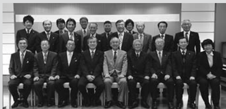
住吉名誉会長就任祝い