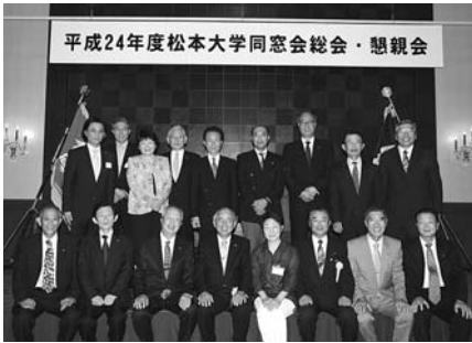
平成24年度松本大学同窓会総会・懇親会

個人の募金も受け付けておりますので、左記までお問い合わせください。 松商学園高等学校硬式野球部 一〇〇年推進プロジェクト事務局 TEL 026313311210